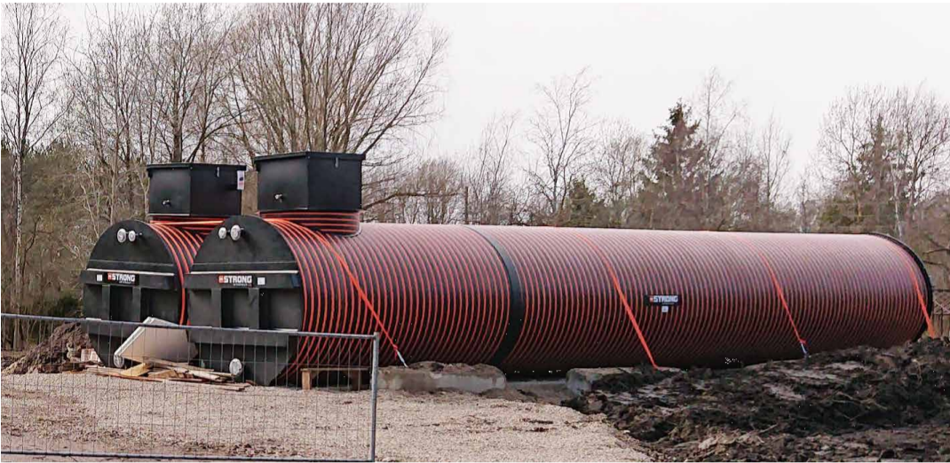
Veereservuaaride paigaldamine Uusküla veetötlusjaamas.

Alates eelmise aasta kevadest on OÜ Loo Vesi koostöös Jõelähtme Vallavalitsusega ellu viinud Euroopa Liidu Ühtekuuluvusfondi (ÜF) toetusel Uusküla küla ühisveevastustuse ja kanalisatsioonisteesüsteemi ehitus-rekonstrueerimistööd. Lisaks alustati käesoleva aasta alguses ÜVK rekonstrueerimistööde II etapiga ka Kostivere keskasulas. Neid töid toetatakse KIK keskkonnaprogrammist.