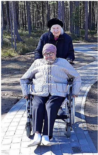
Vastvalminud terviserada on igapäevases tihedas kasutuses.