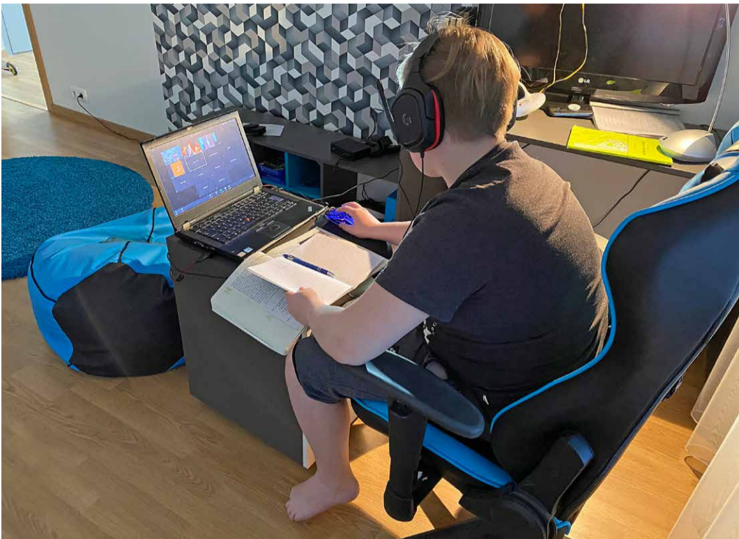
Distsantsõppe veebitund Zoomi keskkonna vahendusel.

Palju erinevaid keskkondi Õppetöökäsitatakse väga paljusid erinevaid virtuaalkesk-