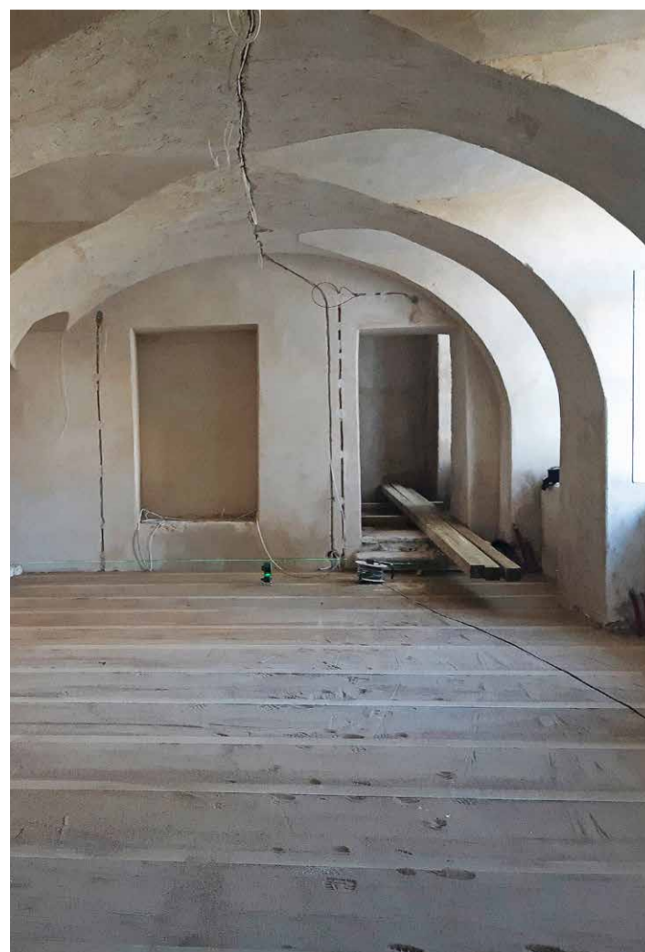
Rekonstrueerimisel olev võlvituba, millest saab muuseumituba. Pilt on tehtud 24. aprillil.

Ajalootuba – praegune võlvituba oli enne renoveerimist kasutusel kinoruumina. Tulevikus saab ajalootoast multifunktsionaalne tuba. Ajalootuppa tuleb virtuaalne ekspositsioon. Jõelähtme valla ajaloolistele materjalidele lisame võimaluse tutvuda praeguste valla oluliste vaatamisväärsustega ning juhustega nendega lähemalt tutvumiseks. Füüsilise näitusega tutvuda soovivad küllalised saavad seda teha jätkuvalt Rebala või Rootsi-Kallavere küla muuseumis. Ajalootuba kasutame ka kino näitamiseks. Uuendame tehnikat. Paigaldame uue projektori ja helitehnikat. 40 m2 ruumis ei ole vaja võimast tehnikat, kuid nelja kõlariga süsteem hetkel oleva kahe kõlari asemel annab filmivaatajale kindlasti parema elamuse. •