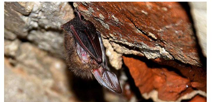
Talvituv Pruun-suurkõrv ( Plecotus auritus ) on euroopas laialt levinud nahkhiireliik.

Keskkonnaministeeriumi selline lähenemine on arusaamatu, sest looduses tuleb kaitseda eelkõige ikka neid isendeid, kes on hetkel olemas ja vajavad